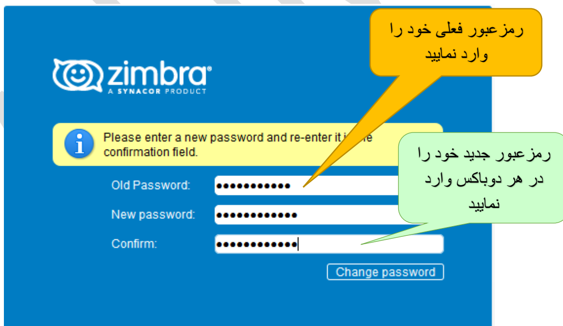
شکل ۴/ صفحه تغییر رمز عبور ایمیل دانشگاهی

پس در صفحه گشوده شده مطابق شکل ۴ رمز عبور ایمیل خود را تغییر داده بعد کلیک Change password را کلیک نمایید.