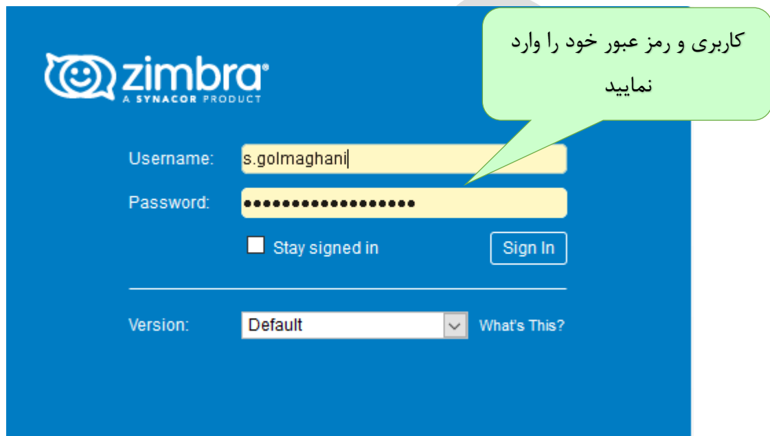
شکل ۱) صفحه اصلی سامانه ایمیل دانشگاه

جهت ورود به سامانه ایمیل دانشگاه روی لینک فوق در صفحه اول دانشگاه کلیک نمایید و یا از طریق آدرس https://zmail.arums.ac.ir وارد صفحه سامانه ایمیل دانشگاهی مطابق شکل ۱ شوید.